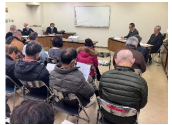
パトロール隊員研修会