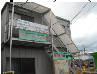
《小作センター》 小作台1-16-1 TEL・FAX 555-8101