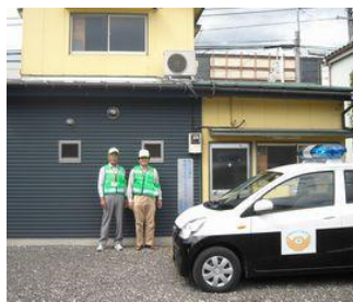
《羽村センター》 羽東1-13-10 TEL・FAX 555-8586